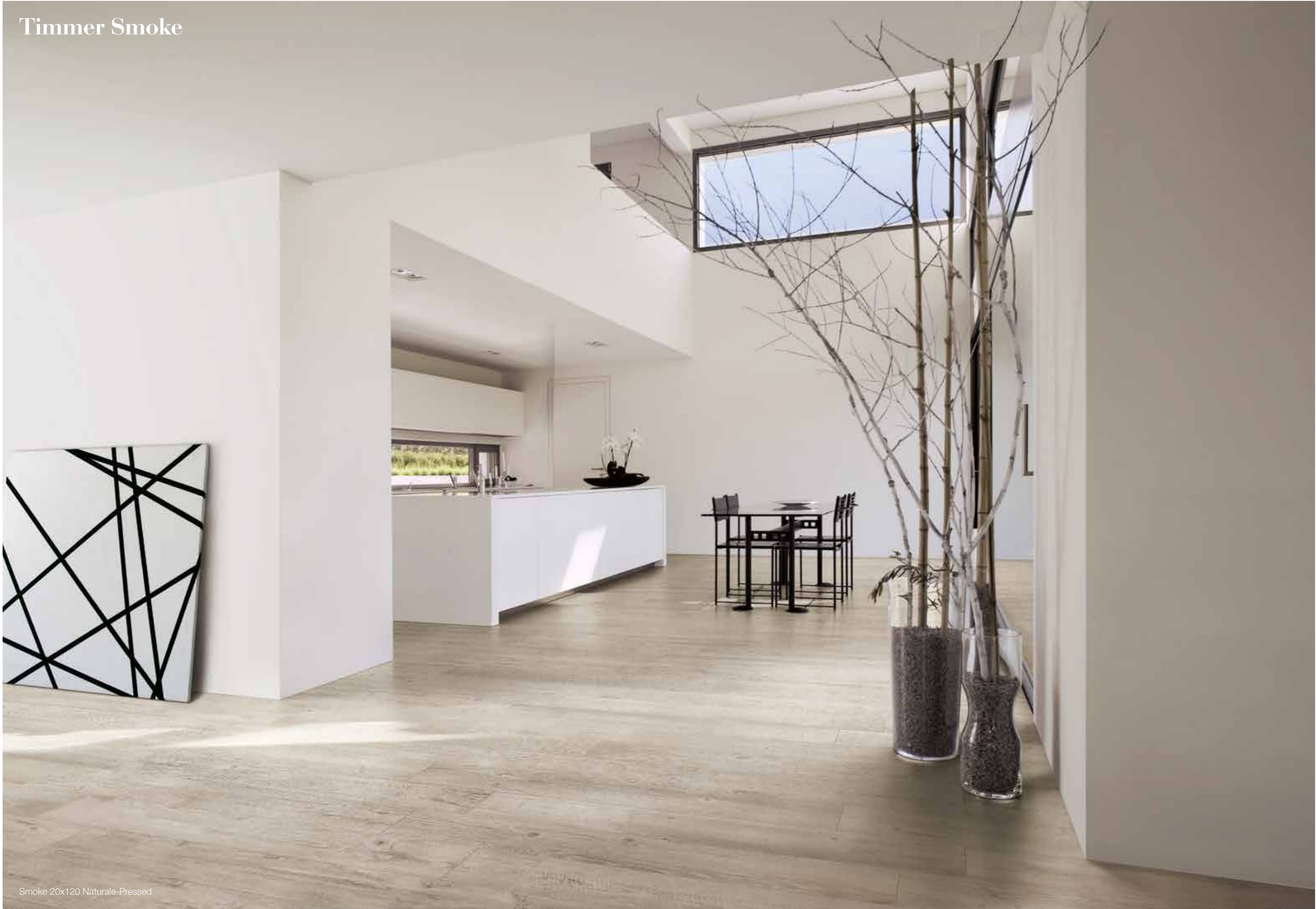
Smoke 20x120 Naturale-Pressed