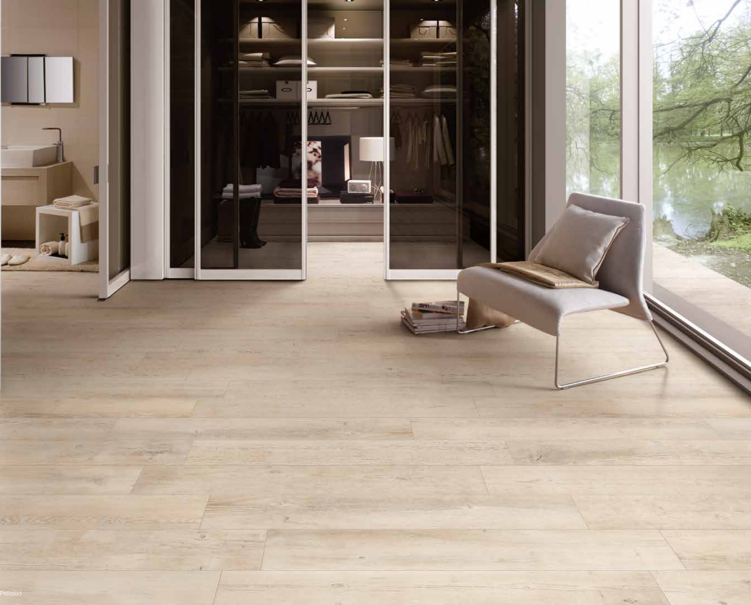
Indoor & Outdoor: Sand 20x120 Naturale-Pressed