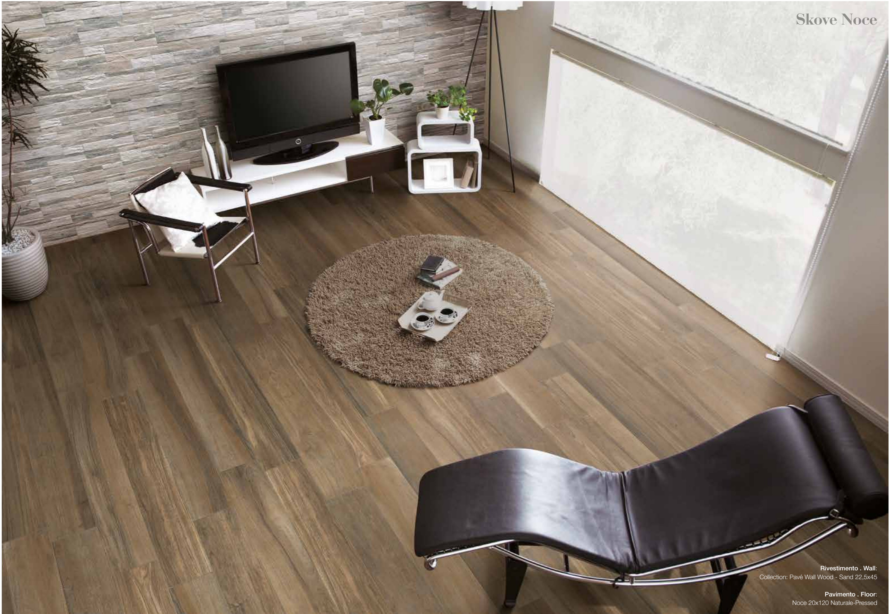
Rivestimento . Wall: Collection: Pavé Wall Wood - Sand 22,5x45