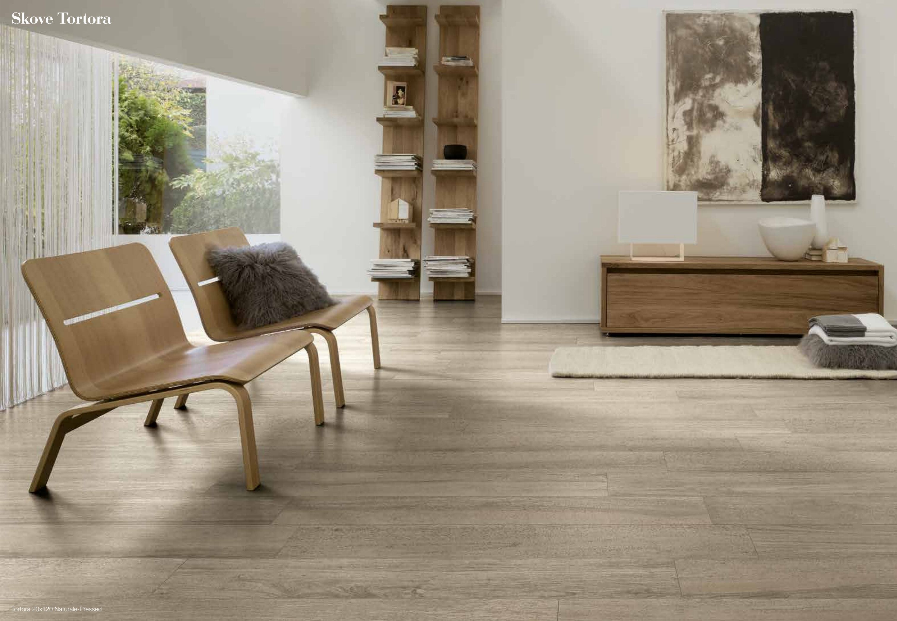
Tortora 20x120 Naturale-Pressed