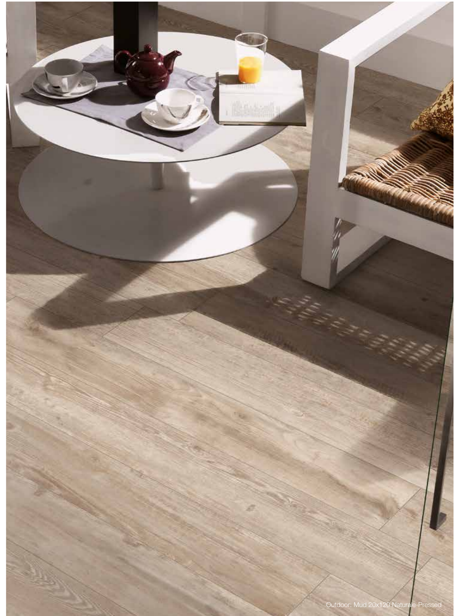
Outdoor: Mud 20x120 Naturale-Pressed

179881 - Ice 179883 - Smoke 179882 - Sand 179884 - Mud