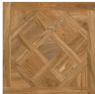
65 Royal Nut 7575