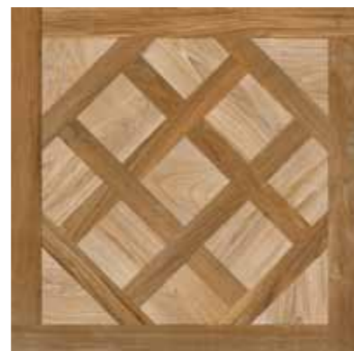
65 Royal Deco Nut 7575