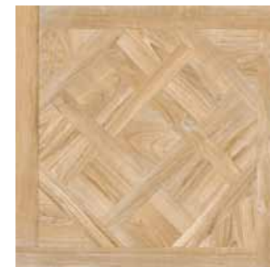
65 Royal Sand 7575