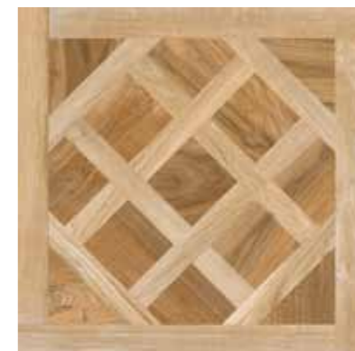
65 Royal Deco Sand 7575